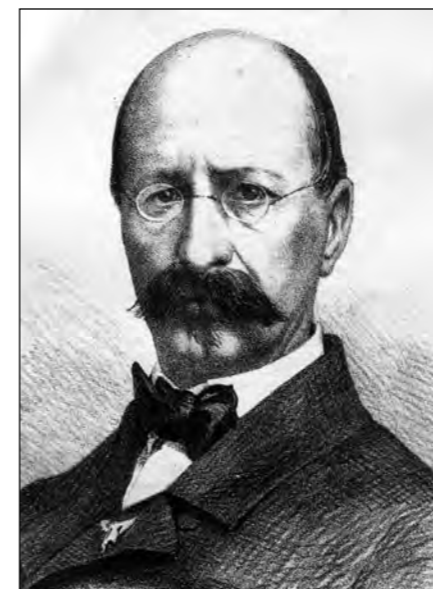
Figure emblématique de la musique suisse et française du XIX e siècle, Louis Niedermeyer est né à Nyon en 1802. Il y résida plus de la moitié de sa vie avant de partir pour Paris où il connut les plus grands succès tant pour ses œuvres vocales et instrumentales que pour son action pédagogique.

La fondation qui porte son nom entend faire revivre l'œuvre de cet illustre nyonnais et, au-delà, défendre un patrimoine intellectuel et artistique de dimension européenne. Elle va contribuer en priorité au financement de la recherche, de la publication et de l'exécution des œuvres de Louis Niedermeyer, ainsi que de manifestations s'y rapportant.