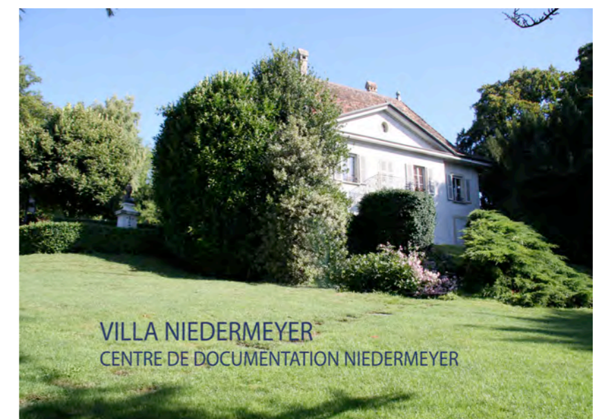
VILLA NIEDERMEYER CENTRE DE DOCUMENTATION NIEDERMEYER

Elles seront accessibles au public, mais plus particulièrement aux chercheurs, musiciens et historiens, étudiants et biographes.